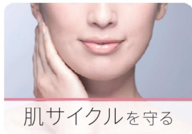
肌サイクルを守る