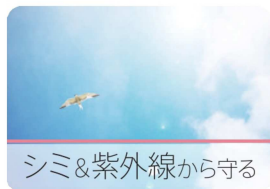
シミ&紫外線から守る